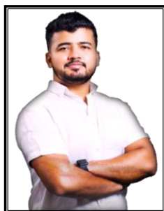
Chief Patron Hon. Dr. Jayant Patil Chairman, Shri Yashwant Shikshan Prasarak Mandal, KODOLI